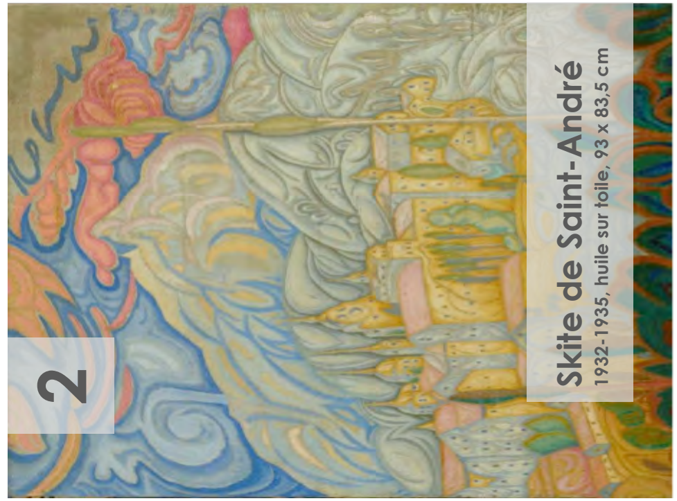
skite de Saint-André 1932-1935, huile sur toile, 93 x 83,5 cm