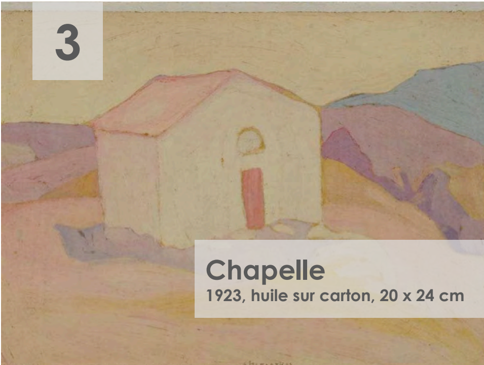
Chapelle 1923, huile sur carton, 20 x 24 cm