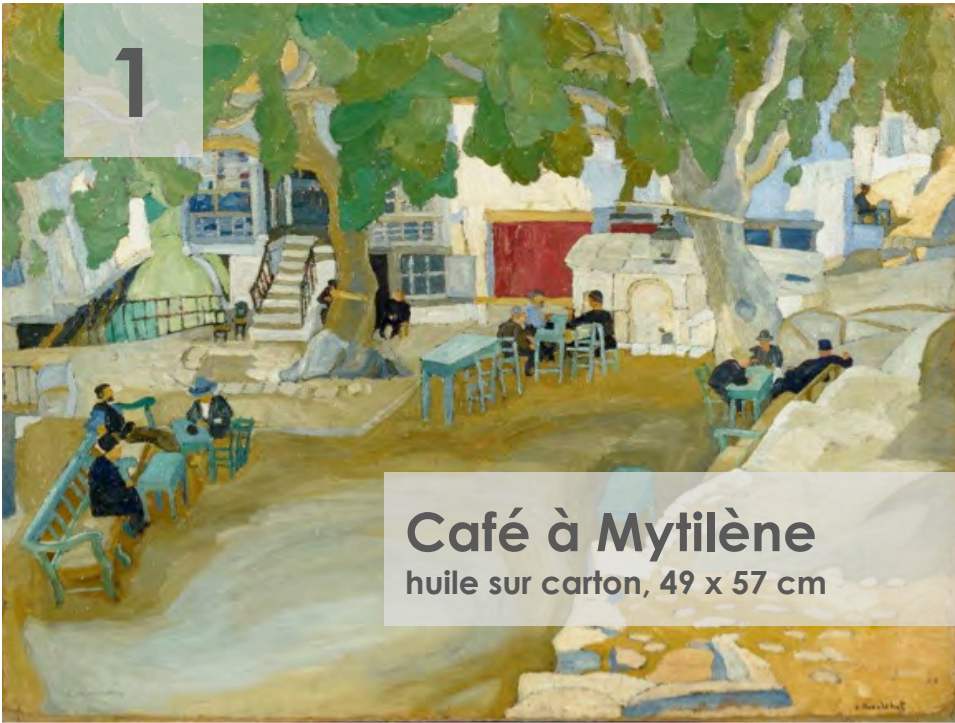
Café à Mytilène huile sur carton, 49 x 57 cm